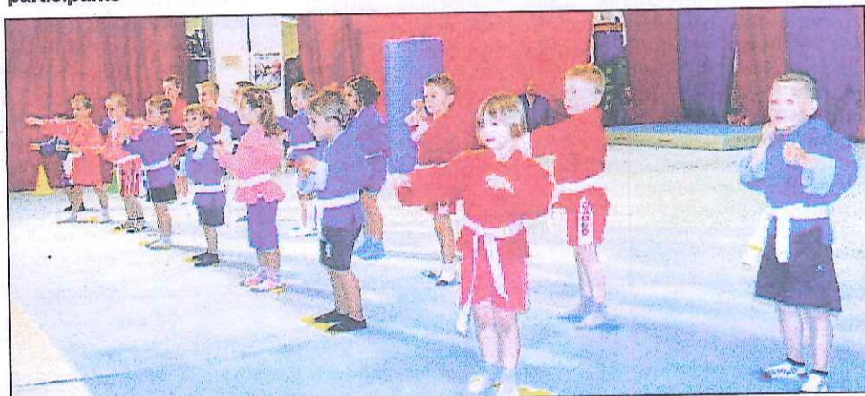
jeunes en action

sion de ces numéros de venir retirer leur lot au club.